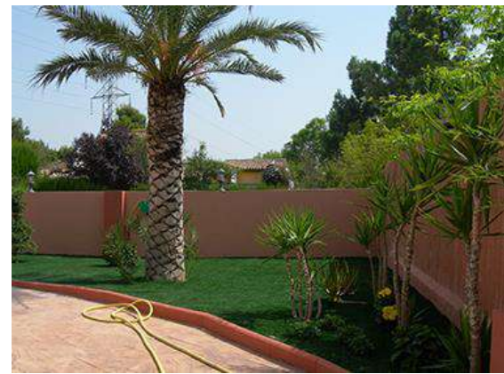
JARDÍN PRIVADO CON CÉSPED ARTIFICIAL