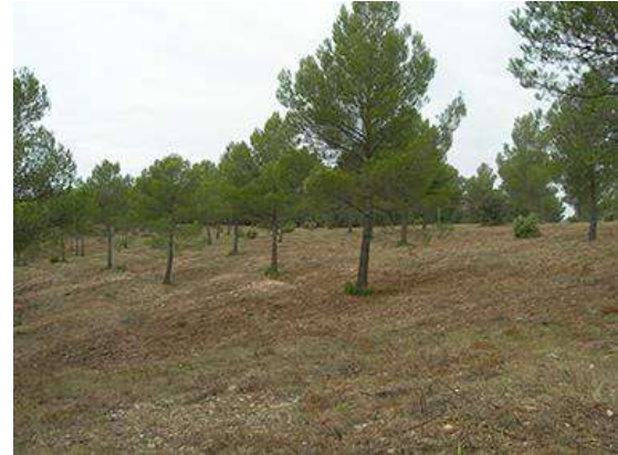
CORTAFUEGOS Y FAJAS AUXILIARES