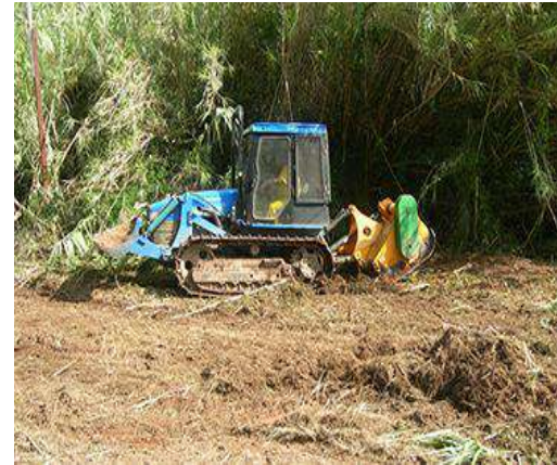
TRACTOR CON CAMPANA DE MARTILLOS