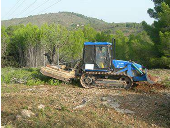
APERTURA DE CORTAFUEGOS