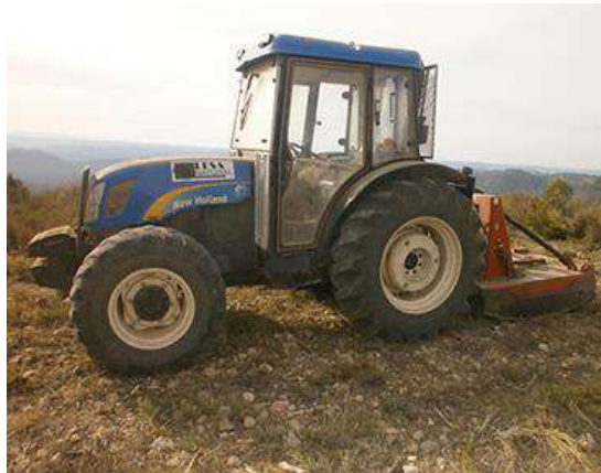
TRACTOR CON CAMPANA DE CADENAS