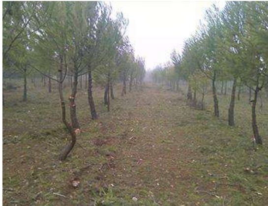
AYUDA A LA REGENERACIÓN