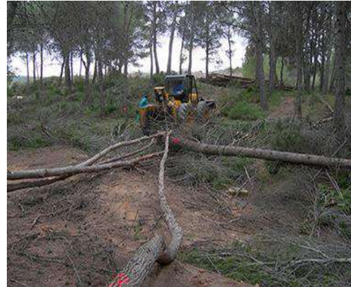
SACA DE MADERA MECANIZADA