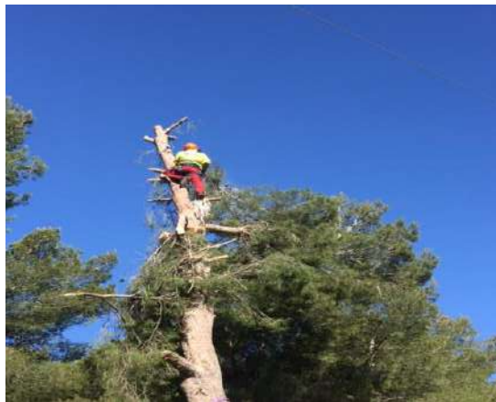
TALA MEDIANTE TREPA